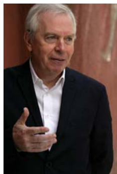
DAVID CHIPPERFIELD architecte commissaire de la biennale d'architecture 2012